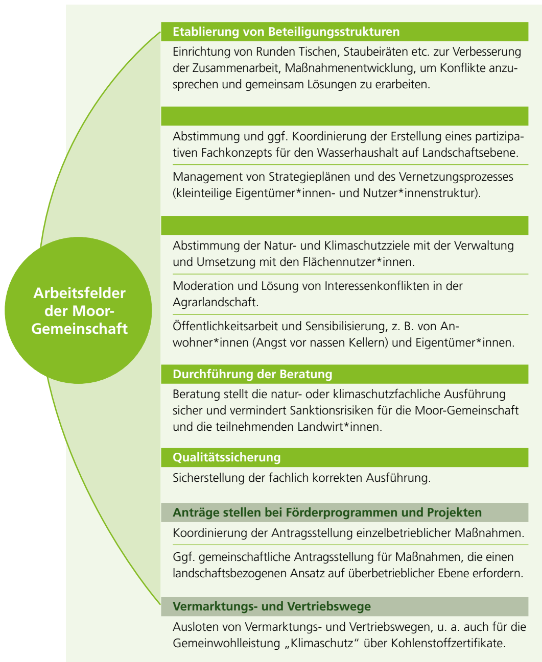
Abbildung 2: Obligatorische (hellgrün) und optionale (dunkelgrün) Aufgabenfelder der Moor-Gemeinschaft, abhängig vom Bedarf der Zielregion.

In anderen Bewirtschaftungsbereichen sind ähnliche Zusammenschlüsse schon länger vorhanden, um gemeinsame Interessen vieler Nutzer*innen zusammenzuführen. Forstbetriebsgemeinschaften sind ein solches Beispiel. Dies sind Zusammenschlüsse von Waldbesitzer*innen, die neben den waldbaulichen Maßnahmen häufig auch die Beratung, Koordination, Vermarktung oder die Fördermittelbeantragung für ihre Mitglieder übernehmen (BWaldG) 16 .