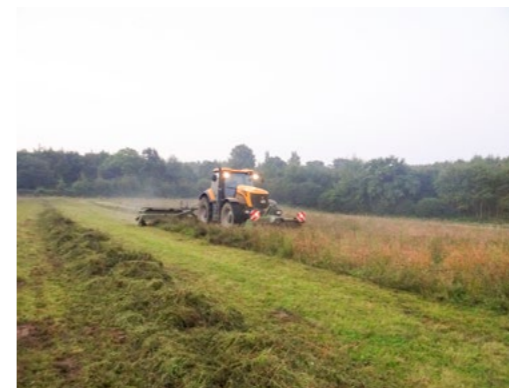
Mahd einer artenreichen Spenderfläche in den frühen Morgenstunden