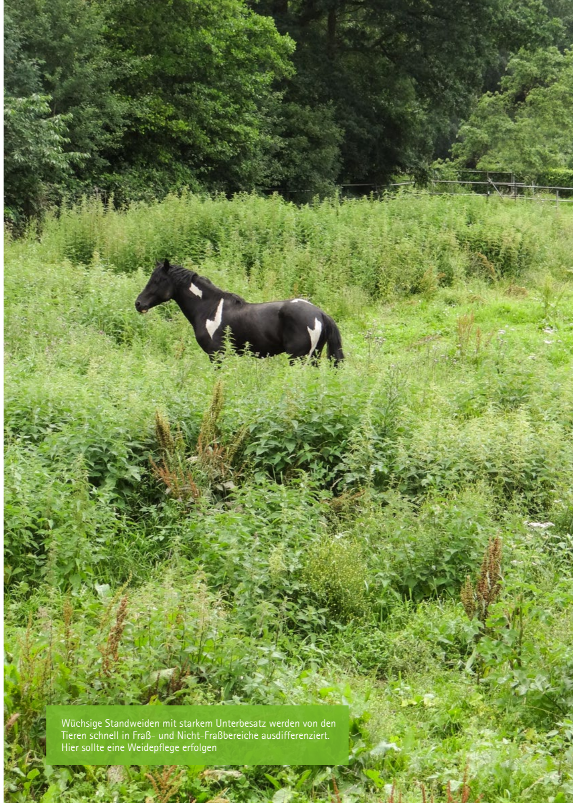
Wüchsige Standweiden mit starkem Unterbesatz werden von den Tieren schnell in Fraß- und Nicht-Fraßbereiche ausdifferenziert. Hier sollte eine Weidepflege erfolgen

Eine Beweidung von trockenem und magerem Grünland ist vor allem mit leichtfuttrigen Pferden des Nordtyps möglich. Dies kann in Form einer Kurzzeitweide mit entsprechender Besatzdichte oder aber als Langzeitweide erfolgen. Mit der Beweidung sollte im Juni/Juli begonnen werden. Die Gefahr der Hufrehe besteht auf diesen Standorten in der Regel nicht. Anspruchsvolle Pferderassen können auf diesem Grünland nur kurzzeitig geweidet werden, da sie sonst unter Unterversorgung leiden.