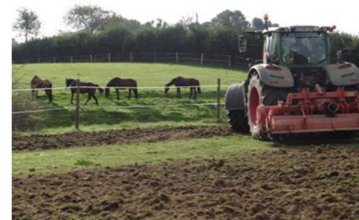
Fräsen einer wüchsigen Grünlandnarbe als Vorbereitung für die Nachsaat mit Regio-Saatgut

Foto: Ansaat mit Regio-Saatgut auf einem ehemaligen Acker mit Wiesen-Fuchsschwanz, Wiesen-Margerite, und Acker-Witwenblume