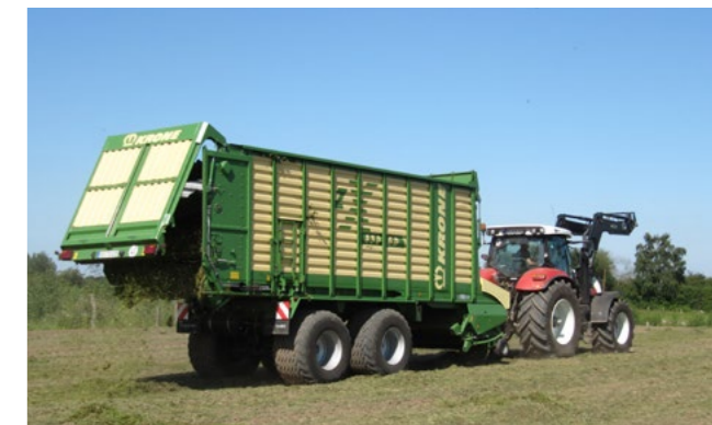
Ausbringung von Spendermahdgut auf der Empfängerfläche