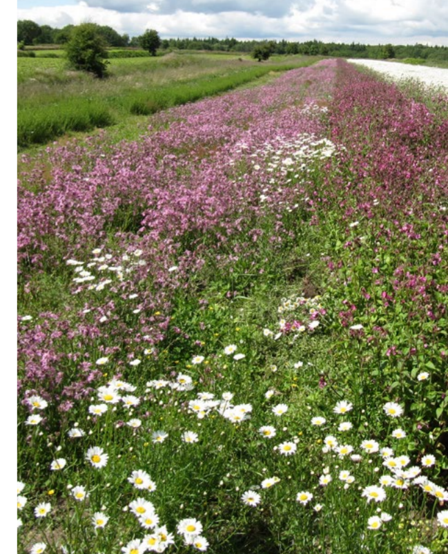
Anbau von Regio-Saatgut mit Kuckucks-Lichtnelke, Roter Lichtnelke und Wiesen-Margerite