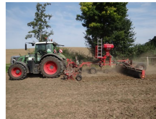
Nachsaat der gefrästen Grünlandfläche mit Regio-Saatgut mit einer pneumatischen Saatriegelkombination